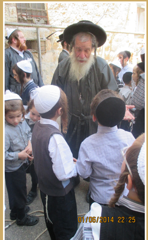
יורד מן ההר אל העם מדבר עם תלמידיו בהארט פנים