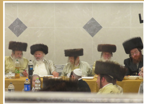
עם אחיו וגיסיו שיבלחט"א