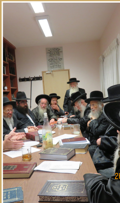
לפני מלכים יתייצב בדיון בלשכת הביד"ץ בעניני קבורה