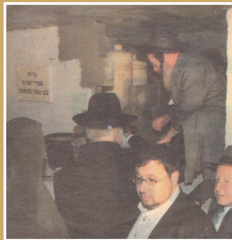
בגניזת ספרי תורה שנשרפו ר"ל

ועוד מזכרונותיו הנעימים בצל שימוש בקודש אצל רביה"ק זי"ע: כידוע היה רביה"ק זי"ע נוהג ללכת בליל שבת קודש אחר קבלת שבת לבקר אצל חסידי קדמאי מירושלים של מעלה. בתקופה שאני זכיתי לשמש בקודש פנימה, כשראיתי בשבתות החורף איך שרביה"ק קופא מקור אחרי הביקורים, כי אמצעי חימום עדיין לא היו כמו היום, ואף בשעת הקידוש היו יכולים לראות עדיין שידיו קפואות מקור - הצעתי לרביה"ק זי"ע ללבוש מלביש הדזוב'ע עם 'פוטער' ('פרווה', 'פעלץ' בגד חורף שיש בפנים שערות המחממות). אולם רבינו סירב, באמרו - בענוותנותו הגדולה - כי הוא אינו מה'שיינע יודן' הלוכשים כך, כי זה היה אז מלבוש מכובד. וכמה שניסיתי לבקש את רבינו לא הועילו הפצרותי, וכאשר אמרתי לו שזה לא דווקא מלבוש מכובד, וישנם גם מירושלים'ער אידן ב'קהל יראים' הלוכשים מלבוש זה, ענה לי בהלצה: אז תקנה לי מקום לתפילה בימים נוראים ב'קהל יראים'... עד שכעבור זמן התרצה רבינו לכך, אך הוסיף בתנאי להכניס את הפרווה בהדזוב'ע רק מבפנים, כך שלא ייראה בחוץ כלל וכלל שום חלק מהפרווה - 'הפעלץ', (ולא כמו שמקובל במלבוש זה שחלק מהפרווה - השערות יוצאות לחוץ מבתי הידיים ובצידי הצוואר).