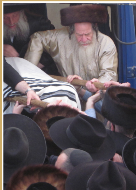
בעבודתו בקודש בפניא דמעלי שבתא

אהבת התורה, שמחת התורה, חשקת התורה, שמחה של מצווה, קנו מזה הרבה