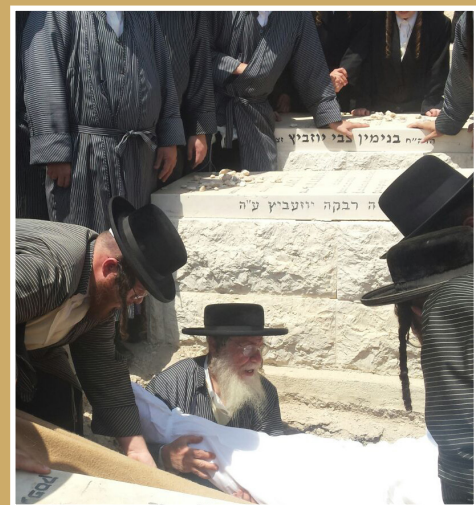
עד זיבולא בתרייתא מחדש כנשר נעוריו לעסוק במצוות קבורה