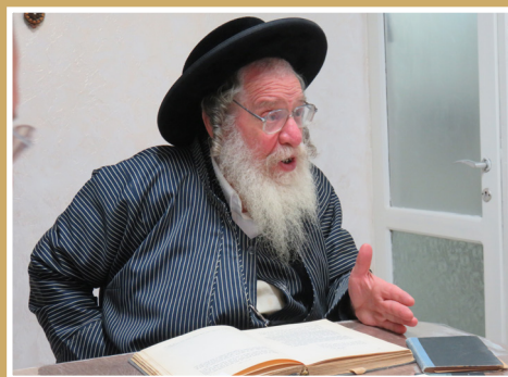
במסירת שיעור בעניני חינוך