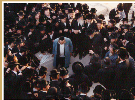
בהלווית הגאב"ד הרמ"א פריינד זצ"ל